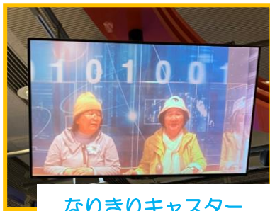
なりきりキャスター

連続テレビ小説部「ブギウギ」で使用した小道具の展示を見学したり、アナウンサーや気象予報士になれる「なりきりスタジオ」を体験したり普段はできない体験してきました。