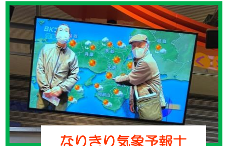
なりきり気象予報士