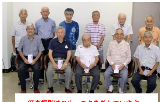
写真撮影時のみマスクを外しています