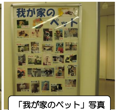
「我が家のペット」写真