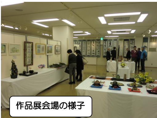
作品展会場の様子

この会員作品展の開催にあたり、多くの会員の皆様にお手伝いをいただき、無事に終了することができました。皆様のご協力、ありがとうございました。