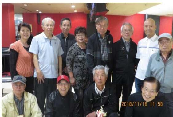
“歓声にはじける笑顔 同好会”(岡)

11月16日(金)に同好会OBや新入会員を迎えて、秋季大会を開催しました。日頃の練習の成果を発揮できた楽しい一日になりました。結果は以下のとおりです。